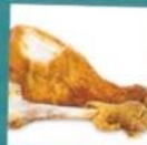
Meat and bones ✓