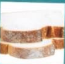
Bread, cakes and pastries ✓