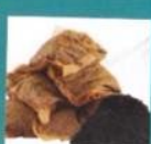
Tea bags and coffee grounds ✓

Your new food waste recycling service can be used for ALL food waste, cooked ✓ or uncooked ✓ - it even takes eggshells and bones!