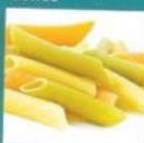
Rice and pasta ✓